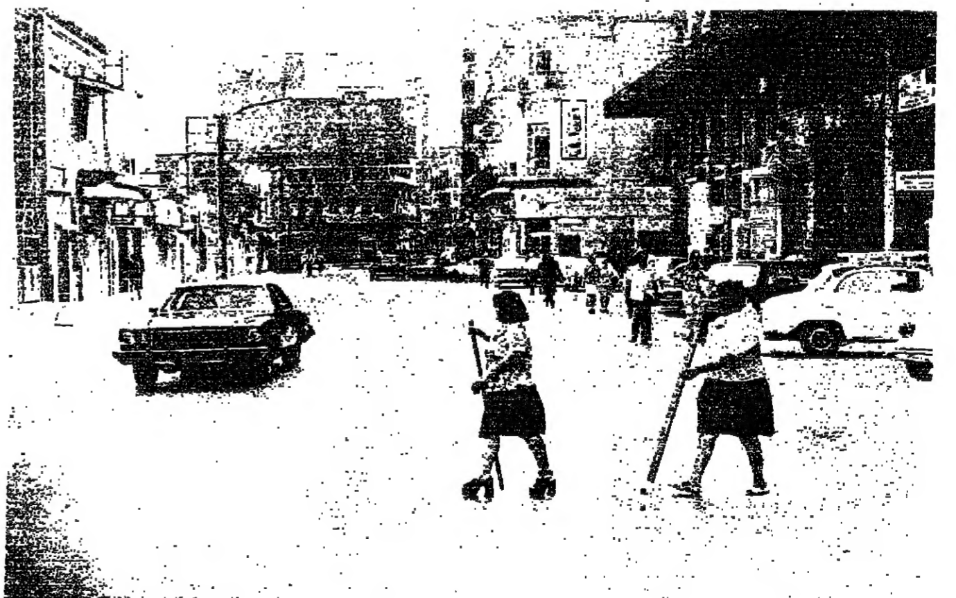
■ العمسا الغليظة سلاحي ممتاز